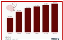
Alzheimerfälle in deutschen Krankenhäusern steigen

Verblüffender Rückgang der Fruchtbarkeit seit über 39 Jahre hinweg lässt die Alarmglocken schrillen – Sind diese Chemikalien Teil einer Entvölkerungsagenda?